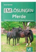
EM·Lösungen Pferde CHF 23.60