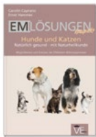
EM-Lösungen Hunde & Katzen CHF 26.90